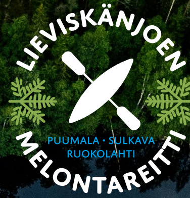
Mainospäijä Ky | Painomäki Oy 2024.